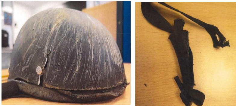
Mynd 4. Hjálmurinn var brotinn á hægri hlið. Á myndinni til hægri sést trosnuð festing hökuólarinnar og brotin plastsmellufesting.

Ökumaðurinn var klæddur í hettupeysu, hannaða sem mótörhjólafatnað, með olnboga og axlarhlífum og var hún CE merkt. Einnig var hann klæddur í þykkt leðurvesti yfir hettupeysuna og með nýrnabelti innanklæða. Hann var í gallabuxum, strigaskóm og með hanska frá mótörhjólaframleiðanda.