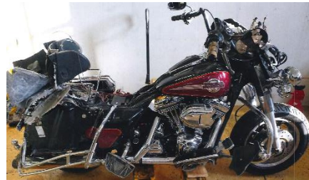
Mynd 3. Bifhjólið. Mynd úr tæknirannsókn.

Bifhjólið var af tegundinni Harley Davidson Touring forskráð í október 2004 en nýskráð í júlí 2006. Bifhjólið var með gilda aðalskoðun, án athugasemda, þegar slysið átti sér stað og átti næstu skoðun í maí 2024. Leyfður farþegafjöldi var einn. Eigin þyngd bifhjólsins var 385 kg.