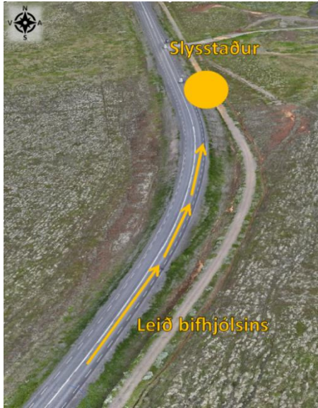
Mynd 2. Yfirlitsmynd sem sýnir vinstri beygju við slysstað. Myndin er tekin til norðurs.

Harley Davidson bifhjóli var ekið Laugarvatnsveg (nr. 35) til norðurs í átt að Laugarvatni. Um 850 metra norðan við gatnamót Laugarvatnsvegar og Biskupstungnabrautar var bifhjólinu ekið fram úr bifreið með hjólhýsi í drætti. Framúraksturinn fór fram í mjúkri vinstri beygju niður aflíðandi