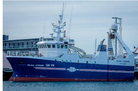
Pálína Þórunn @ Hilmar Snorrason

Skipaskr.nr. 2449 IMO; 9226475 Smíðaður: Kína 2001, stál Útgerð: Nesfiskur ehf. Stærð: 327 BT. Mesta lengd: 28,62 m Skráð lengd: 26,04 m Breidd: 9,17 m Dýpt: 6,05 m Vél: Caterpillar 448 kW, 2000 Fjöldi skipverja: 12