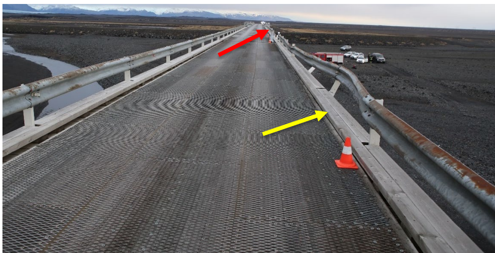
Mynd 1: Mynd frá lögreglu sem sýnir brúna. Gul ör vísar á þann stað þar sem bifreiðin lendir fyrst utan í vegriðinu og rauð ör sýnir hvar bifreiðin fór að endingu út af brúnni.

Þrír farþegar í bifreiðinni létust í slysinu.