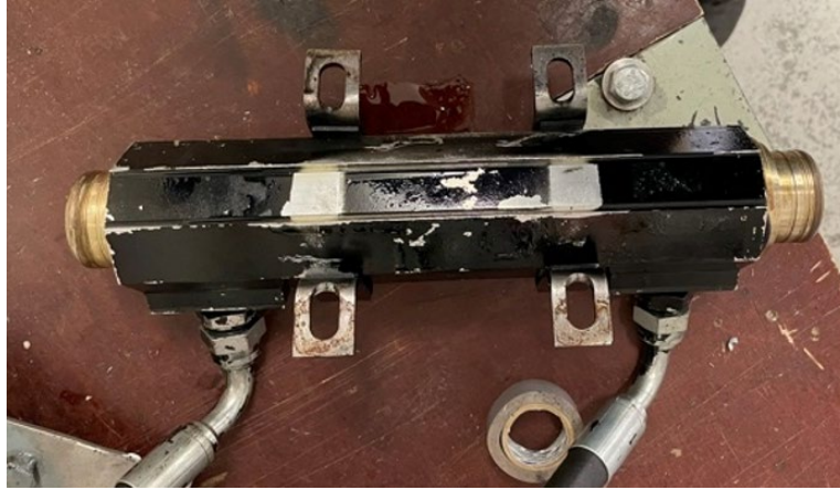
Mynd 2 sýnir olíukælirinn