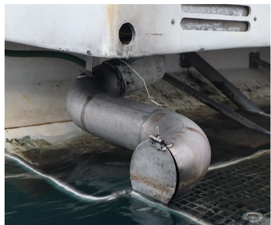
Mynd 1 sýnir púströrið með spjaldloka