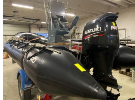
Zodiac báturinn