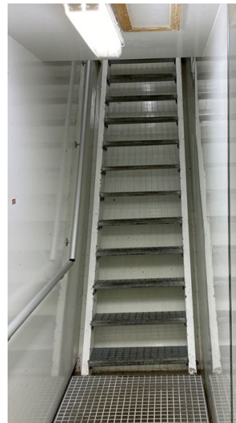
Mynd 1 Stiginn