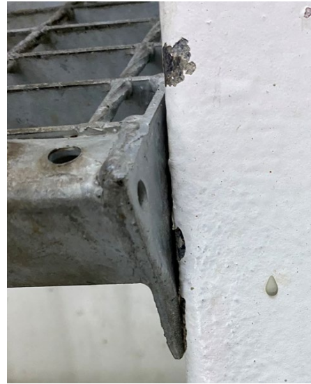
Mynd 3 Þrepin standa út frá burðarbitunum