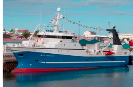
Guðmundur í Nesi

Skipaskr.nr. 2626 IMO nr. 9235438 Útgerð: Útgerðarfélag Reykjavíkur hf. Smíðaður: Langsten Slip & Baatbyggeri árg. 2000 Stærð: 1315 brl. 2464 brt. Mesta lengd: 66 m Skráð lengd: 59,43 m Breidd: 14 m dýpt: 8,6m Vél: Wartsila 5,520 kw árg: 2000 Fjöldi skipverja: 22