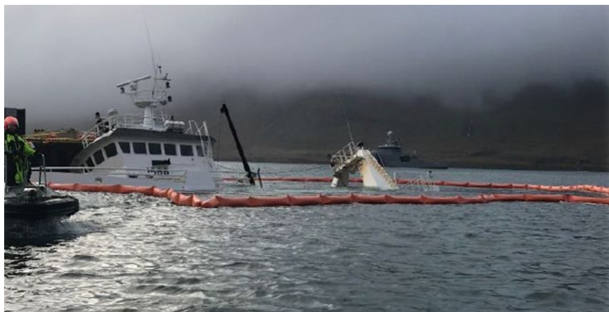
Mynd 1 Skipið sokkið við bryggjuna

Drangur ÁR hafði verið á sæbjúgnaveiðum og komið til Stöðvarfjarðar til löndunar 12. október eftir sólarhring á veiðum. Skipverjar voru í viðhaldsvinnu og lagfæringar á búnaði á vinnsluþilfari fram á þriðjudaginn 20. október en síðdegis þann dag yfirgáfu þeir skipið við bryggju og fóru í frí. Að morgni sunnudags 25. október var kominn það mikill sjór inn í skipið að það lagðist á stjórnborðshliðina og sökk við bryggju. Um 40 tonn af olíu voru í skipinu þannig að björgunaraðilar settu útflotgirðingu í kringum skipið til að koma í veg fyrir mengun.