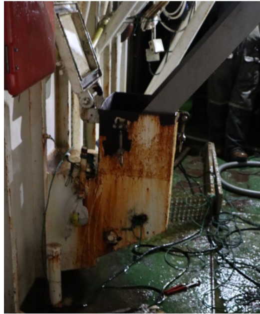
Mynd 4 Slógreinnan á milliþilfarinu.