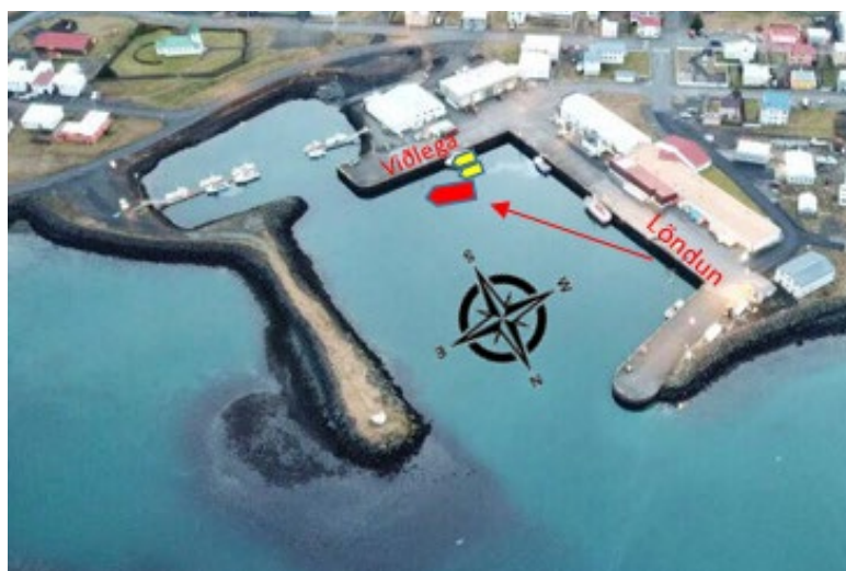
Mynd 1 Gróf afstöðumynd af atvikinu

Skipverjar voru að færa skipið að viðlegukanti eftir löndun við löndunarbryggju og áttu stutt eftir í hann þegar skipstjóri missti stjórn á skipinu með þeim afleiðingum að það rakst með stjórnborðs skut utan í bátana Valdísi ÍS 889 og Guðrúnu SH 90 en hún lá utan á þeim fyrnefnda (mynd 1). Skemmdir urðu á báðum bátunum (mynd 2).