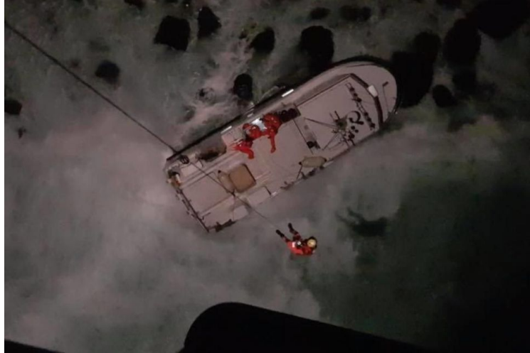
Mynd 1 Áhöfninni bjargað um borð í þyrta LHG

Tveir björgunarbátar ásamt fiskibát fóru á strandstað en gátu hvorki athafnað sig né bjargað áhöfninni vegna brims í fjörunni. Kölluð var út þyrta LHG sem bjargaði áhöfninni ( sjá mynd 2 ) og var farið með hana til Ísafjarðar.