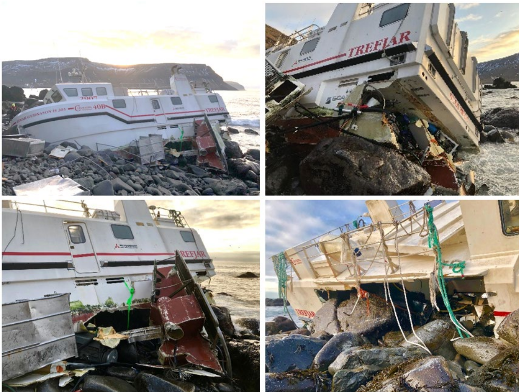
Mynd 3 Einar Guðnason á strandstað og skemmdir

Eins og sjá má á mynd 3 þá eyðilagðist Einar Guðnason algjörlega við strandið og í fjörunni. Nokkrum dögum eftir strandið voru flest ummerki eftir hann horfinn.