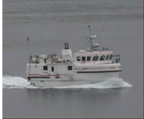
Einar Guðnason

Skipaskr.nr.: 2907 Smíðaður: Trefjar 2015, trefjaplast Útgerð: Norðureyri ehf. Stærð: 21,20 bt. Mesta lengd: 13,52 m Skráð lengd: 11,96 m Breidd: 1,06 m Dýpt: 1,96 m Vél: Doosan, 539 kW, 2015. Fjöldi skipverja: 4