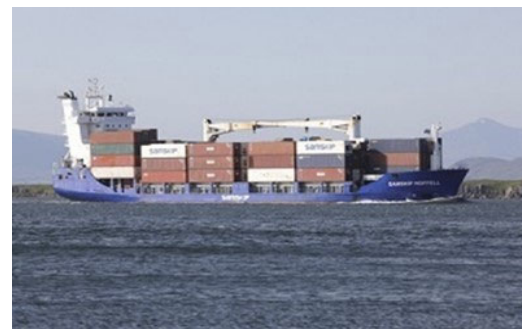
Samskip Hoffell

Um kl. 11:50 var björgunarskipið SS komið að flutningaskipinu SH með stjórnborðssíðu og var þá hafnsögumaðurinn kominn í leiðara sem var á bakborðssíðu skipsins.