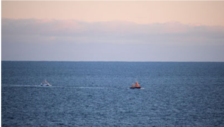
Mynd 2 Björgunarskipið Gunnbjörg með Guðrínu í togi

Björgunarsveitir voru kallaðar út og eftir að báturinn náðist á flot dró björgunarskipið Gunnbjörg hann til Raufarhafnar. Í ljós kom að hællinn hafði laskast og skrúfan eyðilagst.