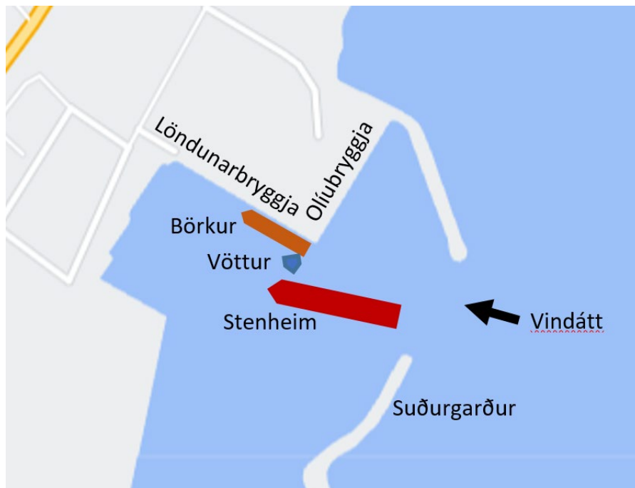
Mynd 1 Gróf afstöðuteikning af vettvangi

Við þetta vildi það til að Vöttur rakst harkalega með bakborðslunninguna utan í Börk NK 122 (sjá mynd 2) sem verið var að landa úr.