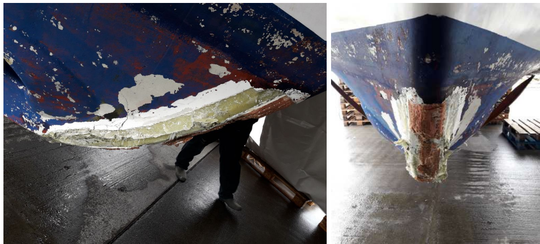
Mynd 2 Skemmdirnar á stefni Sunnutinds

Talsverðar skemmdir urðu m.a. á stefni ( mynd 2 ) og víða á bol bátsins ásamt skemmdum á stýrisbúnaði.