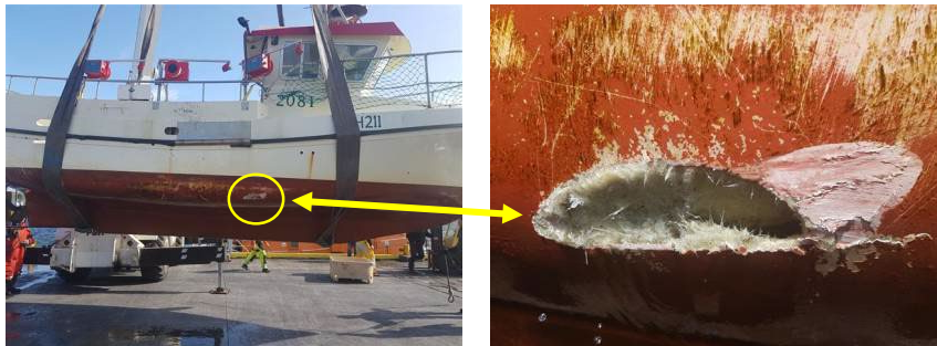
Mynd 2 Skemmdir á Guðrúnu

Í ljós kom að stýri Natalíu hafði dottið af og að skemmdir voru á stjórnborðssíðu Guðrúnar. Hafði hún lent með stjórnborðssíðu á bakborðsskut Natalíu og var 33 cm langt og 8 cm breitt gat á síðu Guðrúnar inn í lestina. Ekki urðu teljandi skemmdir á Natalíu við atvikið.