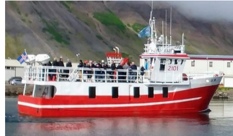
Ölver © Ágúst Haraldsson

Skipaskr.nr. 2101 Smíðaður: Skipabrautin hf, 1990, stál. Stærð: 34,38 brl. 77,00 bt. Mesta lengd: 19,12 m Skráð lengd: 17,28 m Breidd: 4,80 m Dýpt: 4,18 m Vél: Volvo Penta, 220 kW, 1990. Fjöldi skipverja: 2 Fjöldi farþega: 24