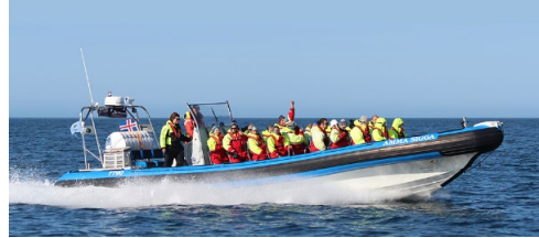
Amma Sigga

Skipaskr.nr. 7790 Utgerð: Gentle Giants-Hvalaferðir ehf Smíðaður: Pólland, 2015, RIB Stærð: 16,24 bt. Mesta lengd: 12,00 m Skráð lengd: 11,50 m Breidd: 3,96 m Dýpt: 1,37 m Vél: Volvo Penta, 588,00 kw, 2015. Fjöldi skipverja: 2 Fjöldi farþega: 9