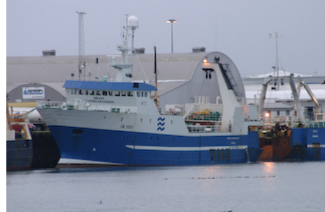
Hrafn Sveinbjarnarson

Skipaskr.nr. 1972 IMO nr. 8709810 Smíðaður: Flekkefjord Noregi 1988 stál Stærð: 290,3 brl. 1028 bt. Mesta lengd: 47,9 m Skráð lengd: 39,3 m Breidd: 11 m Dýpt: 7,45 m Vél: Deutz 1850 kW, 1988 Fjöldi skipverja: 25