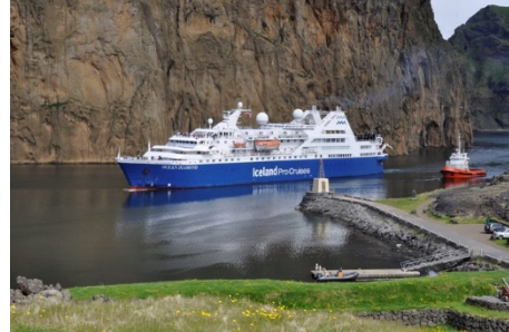
Ocean Diamond

IMO.nr. 7325629 Útgerð: ICELAND PROCRAISES LTD. Fánaríki: Bahamas Smíðaður: 1974, stál Stærð: 8282 GT. Mesta lengd: 124 m Breidd: 16 m Djúprista: 4,9 m Vél: Wichmann xx kw, Fjöldi skipverja: 106 Fjöldi farþega: ??