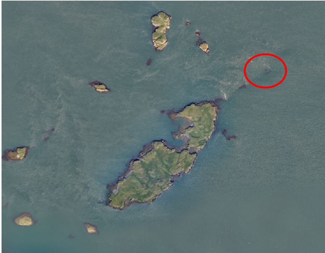
Mynd 4 Loftmynd af Skoreyjum og strandstaður

Um kl. 15:20 losnaði skipið af strandstað og var því siglt undir eigin vélarafli, í fylgd, til hafnar í Stykkishólmi þar sem það var tekið í slipp.