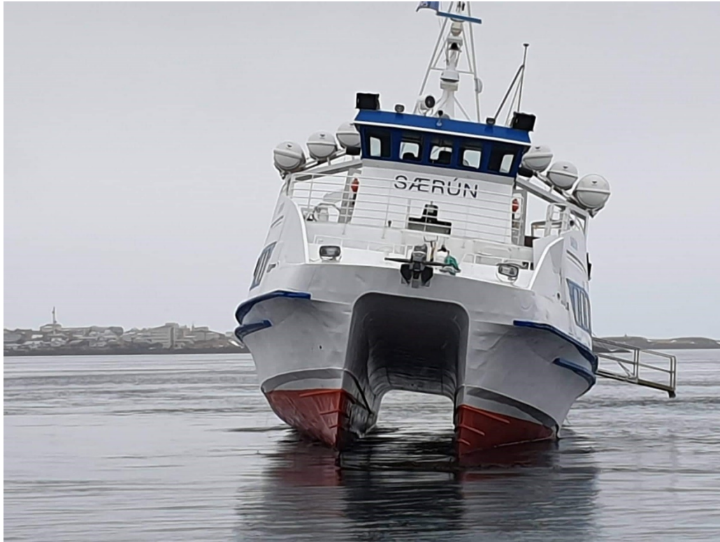
Mynd 2 Særún á strandstað

Kl. 11:35 kallaði skipstjórinn út neyðarkall á VHF rás 16 og upplýsti einnig að leki væri kominn að skipinu og örlítill slagsíða væri komin á það. Um kl 12:30 kom Kristborg SH-108 á vettvang með þrjár dætur sem notaðar voru til að dæla úr skipinu.