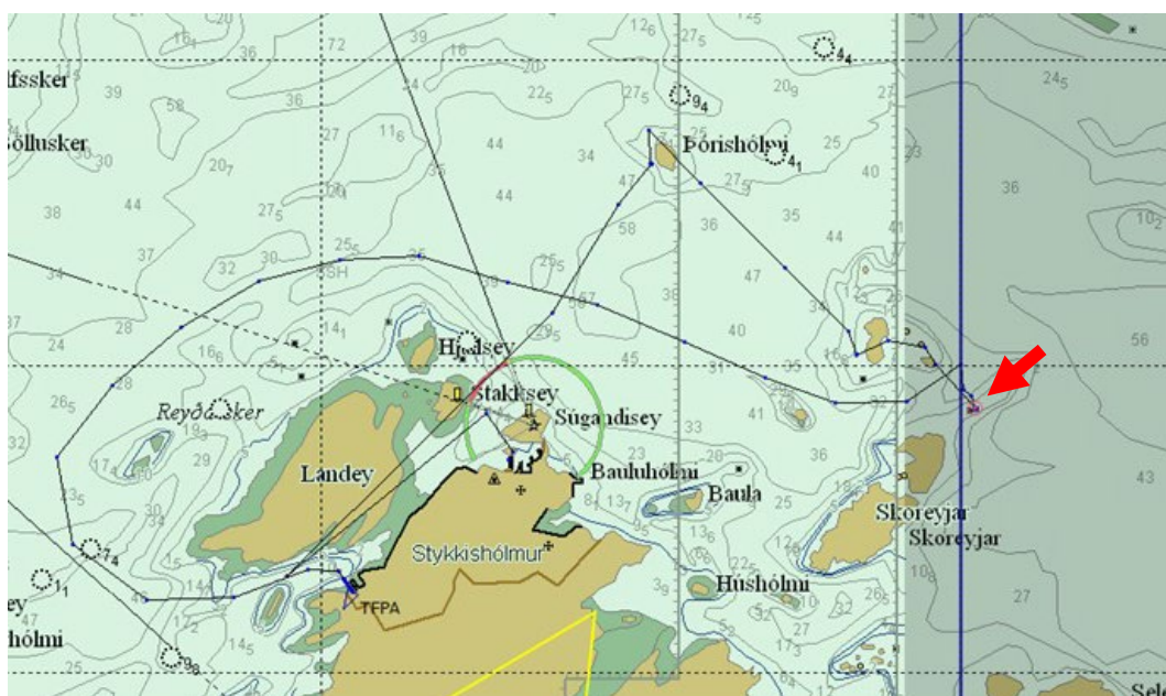
Mynd 1 Ferill Særúnar og strandstaður

Særún fór úr höfn í Stykkishólmi um kl. 11:00 og sigldi fyrst að Þórisshólma en síðan í átt að Skoreyjum. Kl. 11:35 strandaði skipið á skeri rétt NA við Skoreyjar á stað, 65°04'862N og 022°39'884V ( Sjá mynd 1 ).