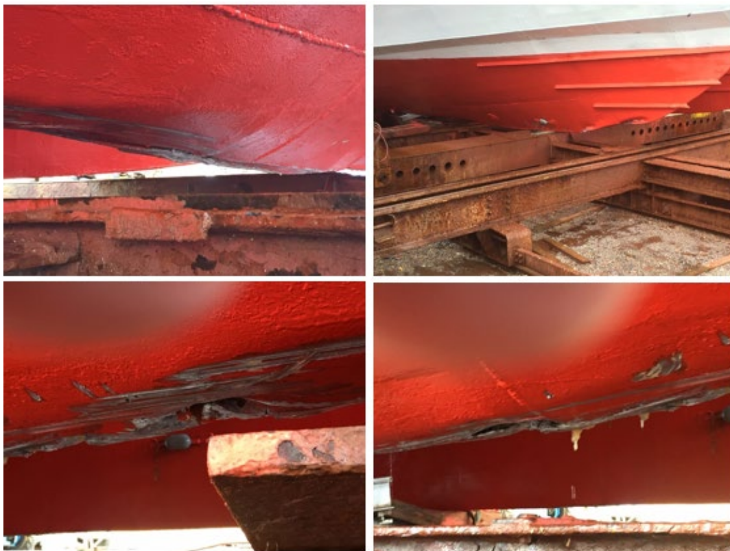
Mynd 5 Skemmdirnar á skipinu

Um kl. 15:20 losnaði skipið af strandstað og var því siglt undir eigin vélarafli, í fylgd, til hafnar í Stykkishólmi þar sem það var tekið í slipp.