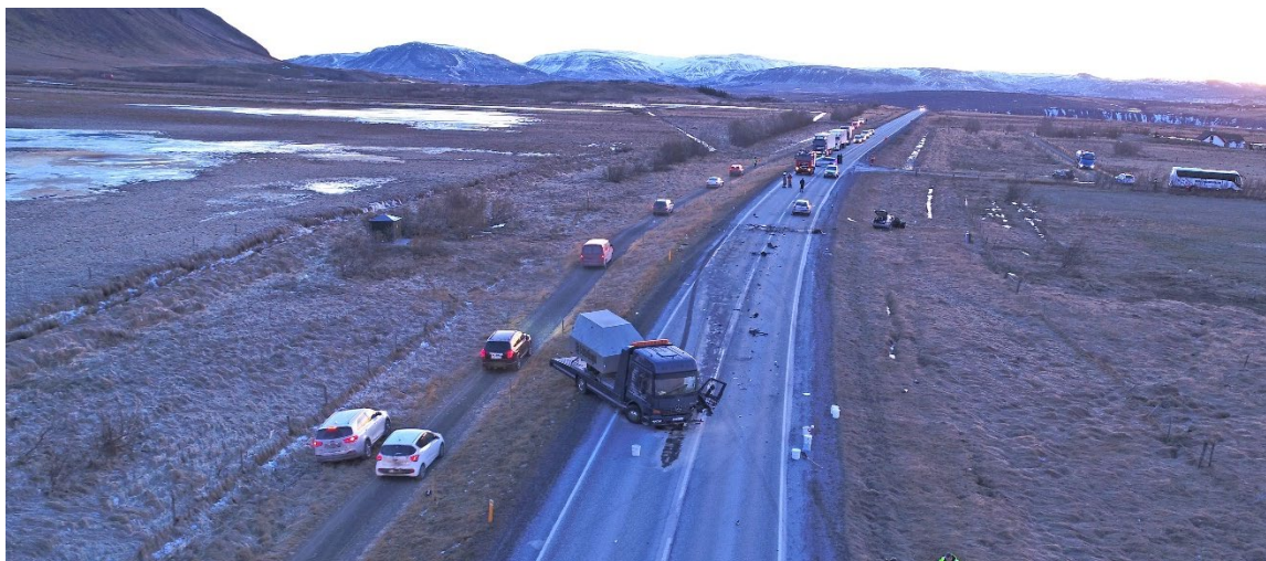
Mynd 1: Mynd tekin í akstursátt (suður) Subaru bifreiðarinnar.

Engin hemla- eða skriðför sáust á vettvangi eftir Subaru bifreiðina. Þar sem áreksturinn varð liggur vegurinn í mjúkri beygju. Sennilegt er að ökumaður Subaru bifreiðarinnar hafi ekki beygt til að fylgja veglínunni og því hafi bifreiðin farið yfir á rangan vegarhelming.