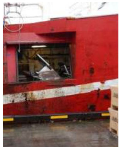
Lúguopið á skipinu

Orsök slyssins má rekja til þess að ekki var notaður landgangur.