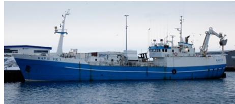
Kap II

Skipaskr.nr. 1062 IMO: 6804692 Útgerð: Vinnslustöðin hf. Smíðaður: Stálvík, 1967, stál Stærð: 407,58 brl. 575,28 bt. Mesta lengd: 52,07 m Skráð lengd: 47,0 m Breidd: 7,90 m Dýpt: 6,20 m Vél: Bergen diesel, 729,0 kw, 1981 Fjöldi skipverja: 12