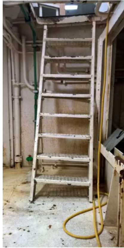
Stiginn niður á vinnsluþilfarið