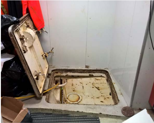
Aðkoman að lúgunni