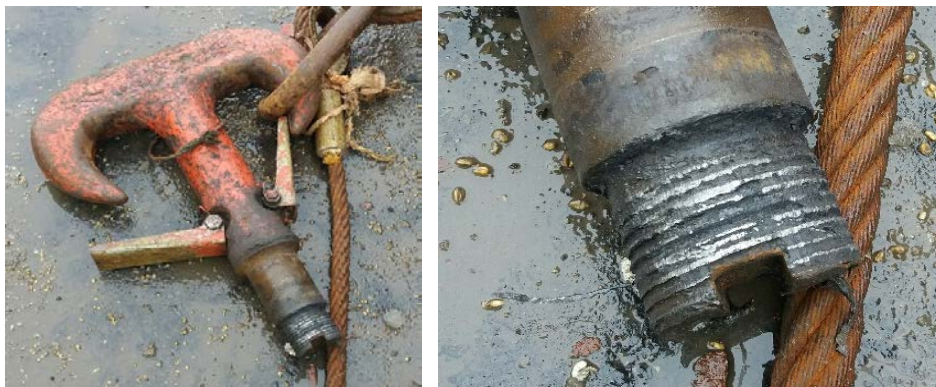
Kranakrókurinn eftir atvikið