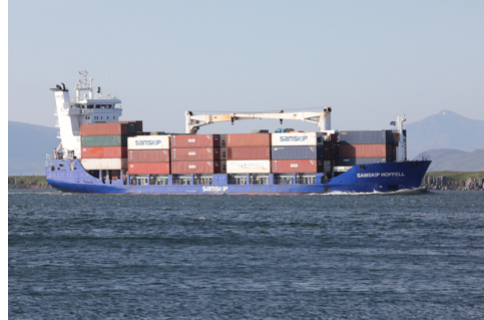
Samskip Hoffell

IMO.nr. 9196943 Útgerð: Samskip, Navtech. Skráning: Rotterdam, Holland, PCLT. Smíðaður: Kína, 2000 Stærð: 4,454 GT 5,536 DWT Mesta lengd: 100,6 m Breidd: 18,8 m Dýpt: 5,8 m Vél: MAN 9L 32/40.