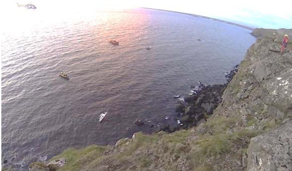
Mynd 2 Joanna á strandstað

Kl. 21:25 fannst báturinn strandaður ( sjá mynd 2 ) og voru mennirnir um borð ómeiddir en kaldir. Þeir voru sendir með þyrlu á sjúkrahús og kl. 23:15 var ljóst að ekkert var hægt að gera fyrir bátinn og sökk hann á staðnum.