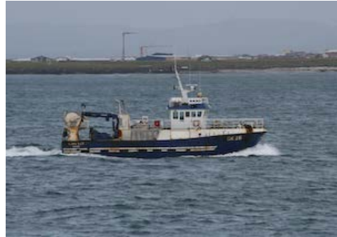
Benni Sæm

Skipaskr.nr. 2430 Smíðaður: Kína 2001, stál Stærð: 94,7 brl. 115,9 bt. Mesta lengd: 21,5 m Skráð lengd: 19,25 m Breidd: 6,4 m Dýpt: 3,2 m Vél: Cummins 448 kW, 2001 Fjöldi skipverja: 6