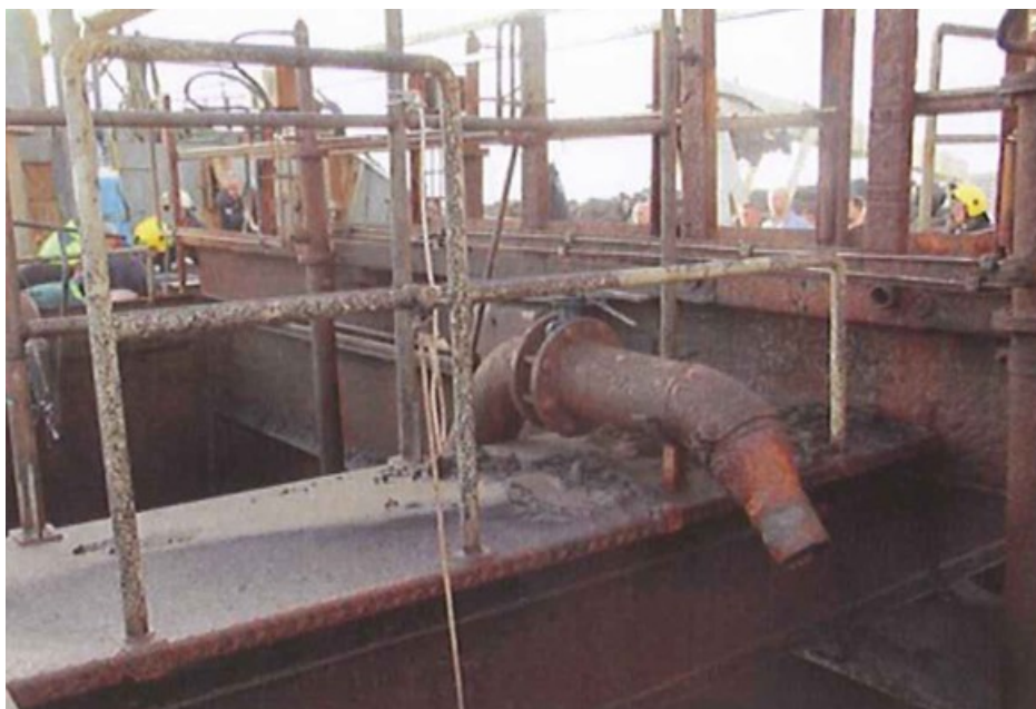
Mynd 1 Myndin sýnir vettvang og sjölögnina sem stúturinn losnaði af

Skipverjinn lenti m.a. á járnbita og slasaðist mikið.