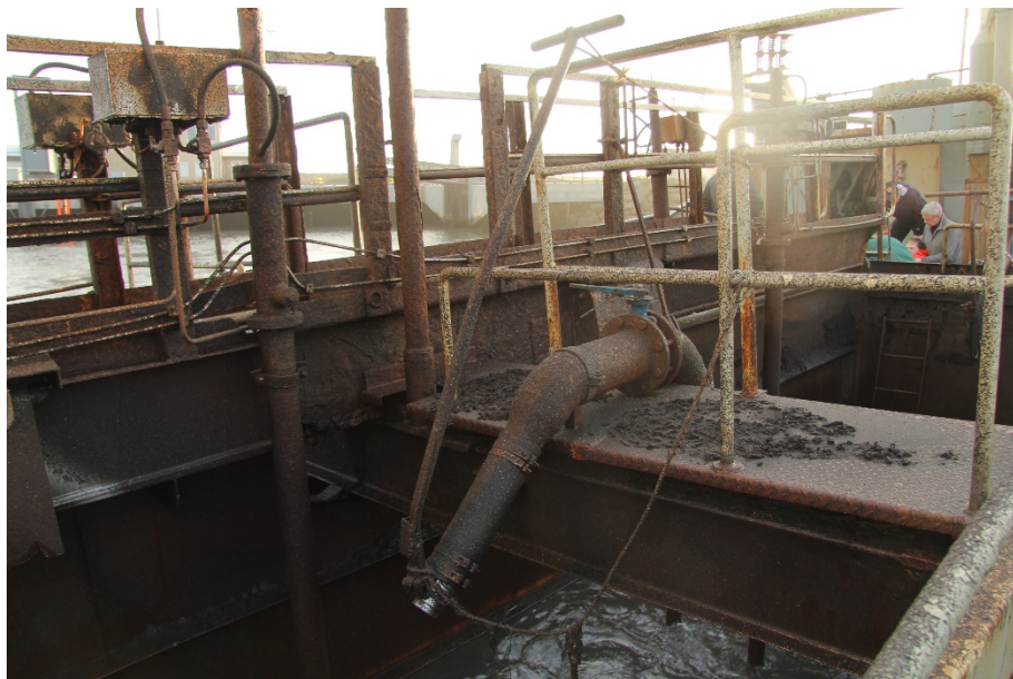
Mynd 3 Myndin sýnir búnaðinn og handfang þegar hann er í lagi