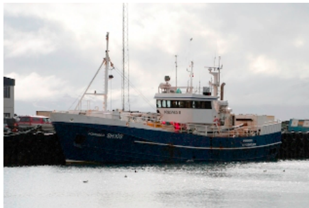
Þórsnes II

Skipaskr.nr. 1424 IMO nr. 7406356 Smíðaður: Akureyri 1975 stál Stærð: 146 brl. 233 bt. Mesta lengd: 31,4 m Skráð lengd: 28,2 m Breidd: 6,7 m Dýpt: 5,6 m Vél: MWM 563 kW 1974 Fjöldi skipverja: 9