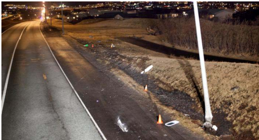
Mynd tekin af vettvangi slyssins í akstursátt bifreiðarinnar. Ljósastaurinn sem bifreiðin ók á sést hér hægra megin á myndinni.

Ökumaður Subaru bifreiðar var einn í bifreið sinni á leið suður Reykjanesbraut seinnipart dags. Var bifreiðinni ekið í miðri röð nokkurra bifreiða. Skyndilega fór bifreiðin út af veginum til hægri. Hægra framhorn hennar hafnaði á ljósastaur með þeim afleiðingum að bifreiðin snerist og valt. Bifreiðin staðnæmdist loks á toppnum utanveggar, eina 46 metra frá ljósastaurnum.