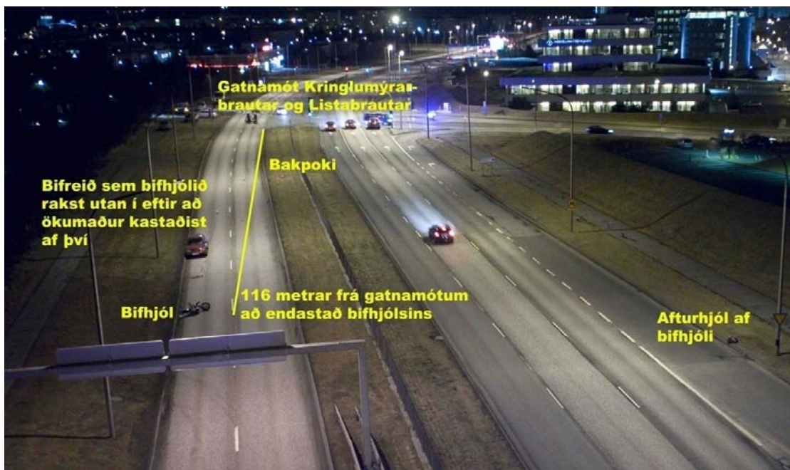
Mynd 2. Yfirlitsmynd af slysavettvangi.

Ökumaður fólksbifreiðarinnar ók brott af vettvangi en var síðar handtekinn.