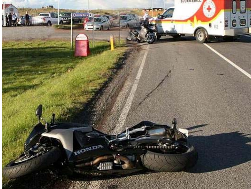
Mynd af bifhjólinu á vettvangi.

Ökumaður fólksbifreiðarinnar sá ekki til bifhjólamannsins né tveggja annarra bifhjóla sem voru skammt fyrir aftan þann sem fremstur fór og taldi því óhætt að beygja inn á planið við Borg. Urðu ökumaður og farþegi í bifreiðinni ekki varir við hjólið fyrr en nokkrum sekúndum fyrir slysið.