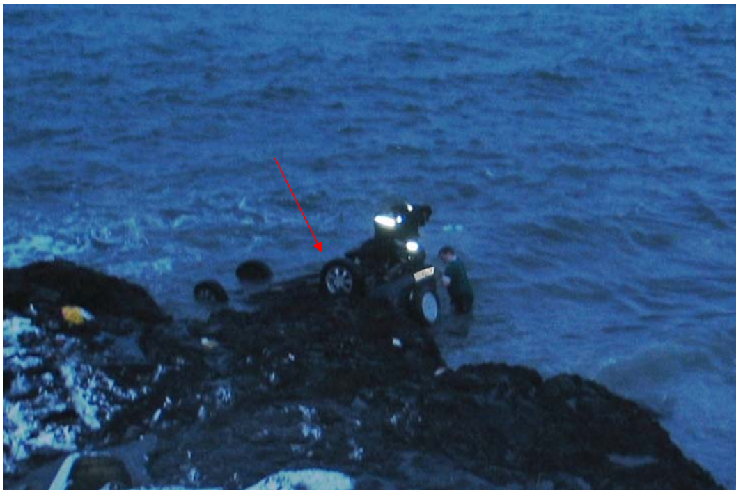
Örin bendir á bifreiðina á hvolfi í fjöruborðinu.

Ökumaður var 17 ára gömul stúlka. Ekki er vitað hvort hún notaði bílbelti. Eftir réttarlæknisfræðilega líkskoðun var drukknun talin líklegasta dánarmein hennar. Stúlkan var ekki undir áhrifum áfengis né vímuefna þegar slysið varð.