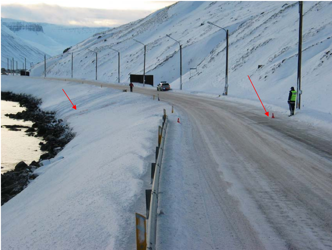
Örvarnar benda á upphaf og enda skriðfara bifreiðarinnar. Nokkuð bratt er fram af vegbrúninni þar sem bifreiðin fór útaf og valt í fjörunni.