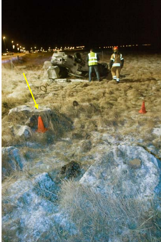
Örin vísar á grjót sem fólksbifreiðin fór yfir

Toyota bifreiðin var skoðuð af bíltæknisérfræðingi. Taldi hann verulegar líkur á að eldur hafi fyrst kviknað þegar tvö göt mynduðust fremst á bensíngeymi þegar ökutækið lenti ofan á steini við útafaksturinn og bensínið úðast yfir púströrið. Ekki voru vísbendingar um að orsök slyssins mætti rekja til ástands ökutækisins fyrir slysið.