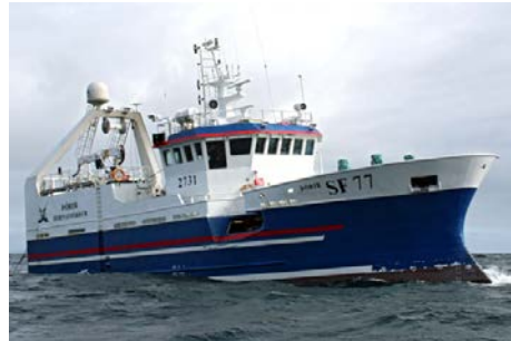
Þórir©Guðmundur St. Valdimarsson

Skipaskr.nr. 2731 IMO nr. 9395903 Smíðaður: Taiwan 2009, stál Stærð: 383,2 bt. Mesta lengd: 28,88 m Skráð lengd: 26,3 m Breidd: 9,2 m Dýpt: 6,8 m Vél: Mitsubishi 523 kW, 2006 Fjöldi skipverja: 10