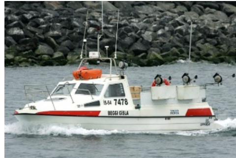
Beggi Gísla

Skipaskr.nr. 7478 Smíðaður: Hafnarfirði 1998 plast Stærð: 4,89 brl. 5,68 bt. Mesta lengd: 9,49 m Skráð lengd: 8,58 m Breidd: 2,49 m Dýpt: 0,89 m Vél: Volvo Penta 190 kW 1998 Fjöldi skipverja: 1