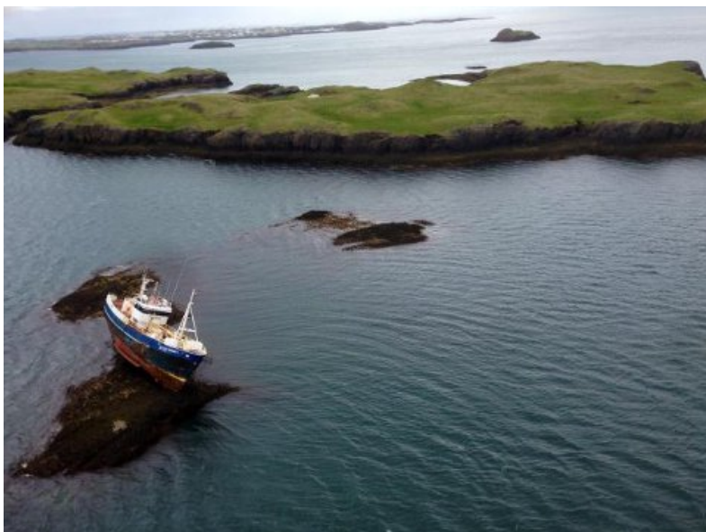
Mynd 2 Strandstaður úr lofti (Stykkishólmur í baksýn)

Kl. 11:15 fór RNSA ásamt björgunarsveit á strandstað og þegar komið var að Þórsnesi II var búið að falla út í rúmar tvær klst. og stóð skipið á miðskeri. Framan við það var boði kominn úr sjó en ekki fallið frá tveimur öðrum við skipið. Halli skipsins var þá orðinn u.þ.b. 30-40° og ekki að sjá neinar skemmdir.