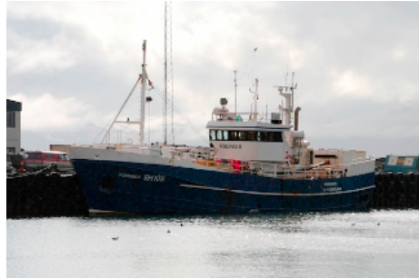
Þórsnes II

Skipaskr.nr. 1424 IMO nr. 7406356 Smíðaður: Akureyri 1975 stál Stærð: 146 brl. 233 bt. Mesta lengd: 31,4 m Skráð lengd: 28,2 m Breidd: 6,7 m Dýpt: 5,6 m Vél: MWM 563 kW, 1974 Fjöldi skipverja: 9