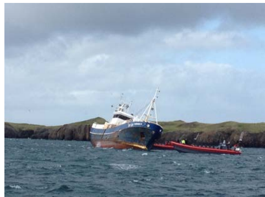
Mynd 1 Þórsnes II á strandstað

Skipið var á beitukónsveiðum við Skoreyjar og voru skipverjar nýbúnir að draga trossu með 100 gildrum en í ráði var að leggja hana aftur en þá nær eyjunni. Endi trossunnar var lagður á um 18 metra dýpi og skipinu beygt til stjórnborða frá landi aftur en þá tók skipstjóri eftir að það fór að grynka mikið undir skipinu.