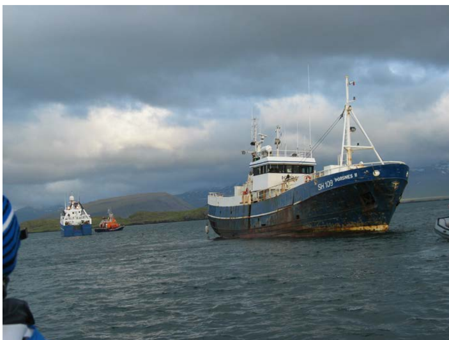
Mynd 4 Þórsnes II laus af strandstað

Háflóð var á strandstað um kl. 22:10 en togskipið Helgi SH 135 kom frá Grundarfirði og var búið að koma taugum á milli skipanna fyrir þann tíma. Dráttarstefna átti að vera í r.v. 190°.