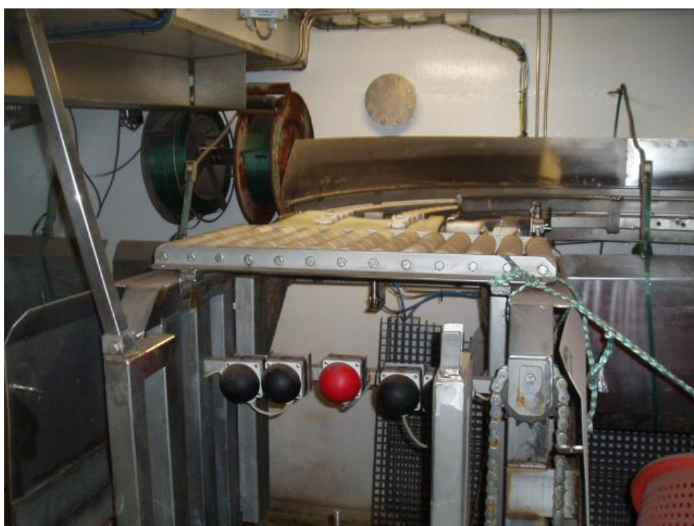
Neyðarstöðvun (rauður hnappur) á nýjum stað