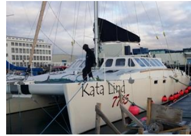
Kata Lind@Tryggvi Guðmundsson

Skipaskr.nr. 7765 Smíðaður: Hafnarfirði 2013 plast Stærð: brl. 56,06 bt. Mesta lengd: 14,97 m Skráð lengd: 14,97 m Breidd: 8,07 Dýpt: 2,05 Vél: Nanni 2* 39,7 kW 2010 Fjöldi skipverja: 4