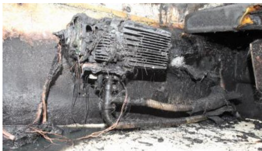
Olúhitarinn og lagnir