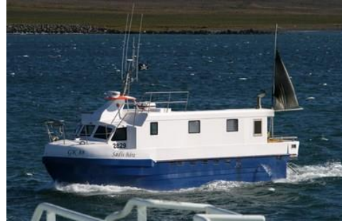
Sædís Bára

Skipaskr.nr. 2829 Smíðaður: Njarðvík 2012, plast Stærð: 14,35 bt. Mesta lengd: 12,85 m Skráð lengd: 11,67 m Breidd: 3,40 m Dýpt: 1,64 m Vél: Mermaid 186 kW, 1991 Fjöldi skipverja: