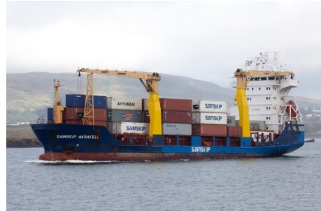
Samskip Akrafell

Skipaskr.nr.: 9271963 Smíðaður: Kína 2003, stál Fánaríki: Kýpur Stærð: 4.450 Gt Mesta lengd: 99,99 m Breidd: 18,60 m Dýpt: m Vél: MAN 4320 kW, 2003 Fjöldi skipverja: 13