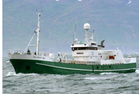
Páll Jónsson

Skipaskr.nr. 1030 IMO nr. 6704892 Smíðaður: Hollandi 1967, stál Stærð: 299 brl. 402 bt. Mesta lengd: 43,90 m Skráð lengd: 40,36 m Breidd: 7,60 m Dýpt: 6,30 m Vél: Grenaa 662 kW, 1981 Fjöldi skipverja: 14