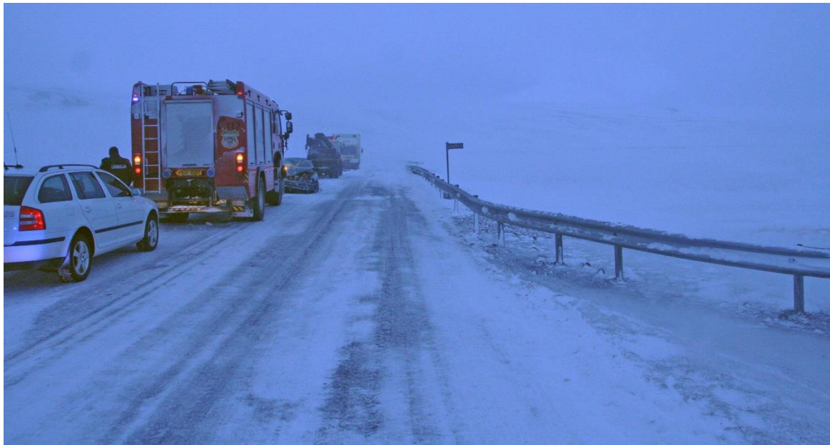
Mynd 1: Mynd af vettvangi tekin í akstursátt fólksbifreiðarinnar við vegriðsendann.

Við enda vegriðs sem liggur yfir brúna yfir Norðurá við Fornahvamm hafði skafið í skafl sem gekk inn á akrein til norðurs. Samkvæmt vitnum missti ökumaður fólksbifreiðarinnar stjórn á henni þegar hann ók yfir skaflinn. Bifreiðin byrjaði að rása til á veginum og rann því sem næst á hlið framan á vöruflutningabifreiðina. Ökumaður hennar hemlaði og vék til hægri áður en til áreksturs kom. Ummerki voru um að vöruflutningabifreiðinni hafi verið ekið utan í vegriðið. Samkvæmt ökuritaskífu var hraði vörubifreiðarinnar 69 km/klst. rétt fyrir slysið og þegar bifreiðarnar skullu saman var hraðinn kominn niður í um 30 km/klst. Útreikningar á hraða fólksbifreiðarinnar benda til að hraði hennar hafi verið um 70 til 80 km/klst áður en henni var ekið í gegnum skaflinn.