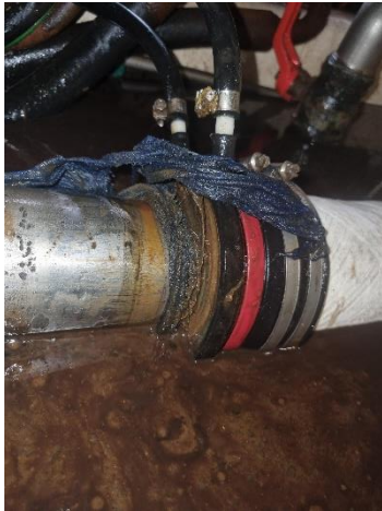
Mynd 1 Sýnir tuskuna vafða utan um skrúfuöxulþéttið.