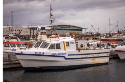
Ársæll Sigurðsson@Hilmar Snorrason

Skipaskr.nr. 2581 Útgerð: Sæli ehf. Smíðaður: Mótun 2003 Stærð: 14.87 BT Mesta lengd: 11.8 m Skráð lengd: 11.45 m Breidd: 3.66 m Dýpt: 1,34 m Vél: CUMMINS, 302.4 kW, 2003. Fjöldi skipverja: 1