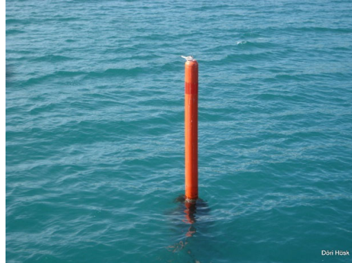
Mynd 4 Baujan fyrir utan höfnin