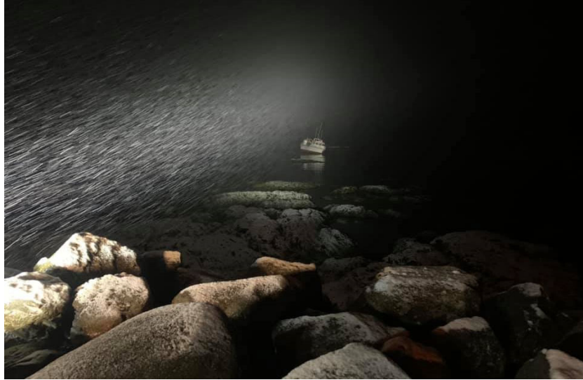
Mynd 2 Steini á strandstað fyrir utan höfnina

Björgunarbáturinn Pólstjarnan dró Steina af strandstað og til hafnar. Engar skemmdir urðu á bátnum.