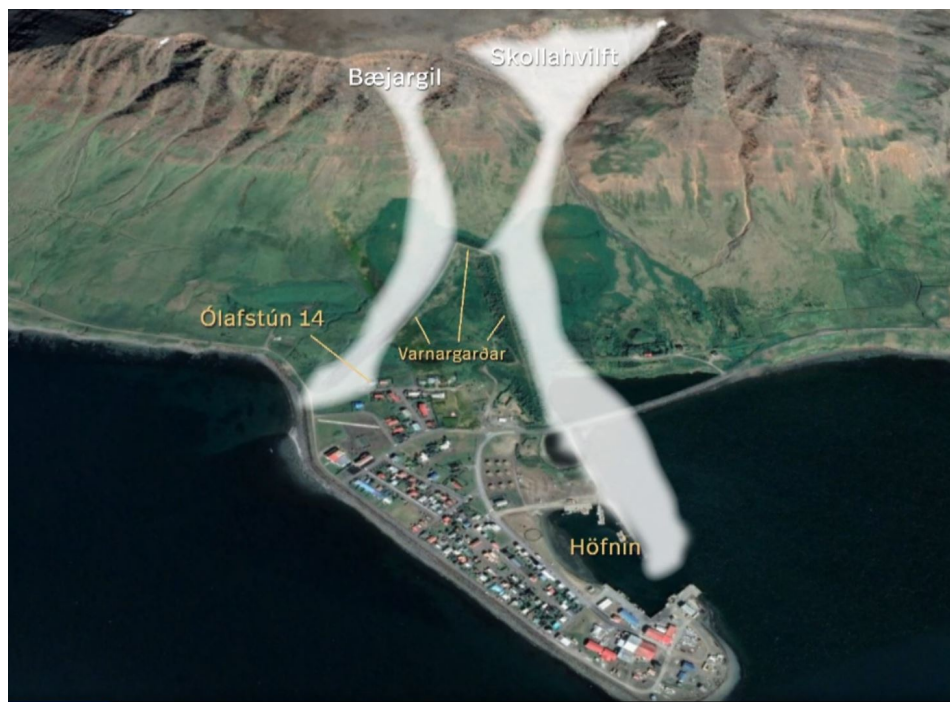
Mynd 1 Myndin sýnir hvernig snjóflóðið féll í höfnina

Um kl. 23:30 féll snjóflóð úr Skollahvilft fyrir ofan bæinn og náði flóðið niður í höfnina með þeim afleiðingum að Eiður hvolfdi og sökk ásamt öðrum bátum.