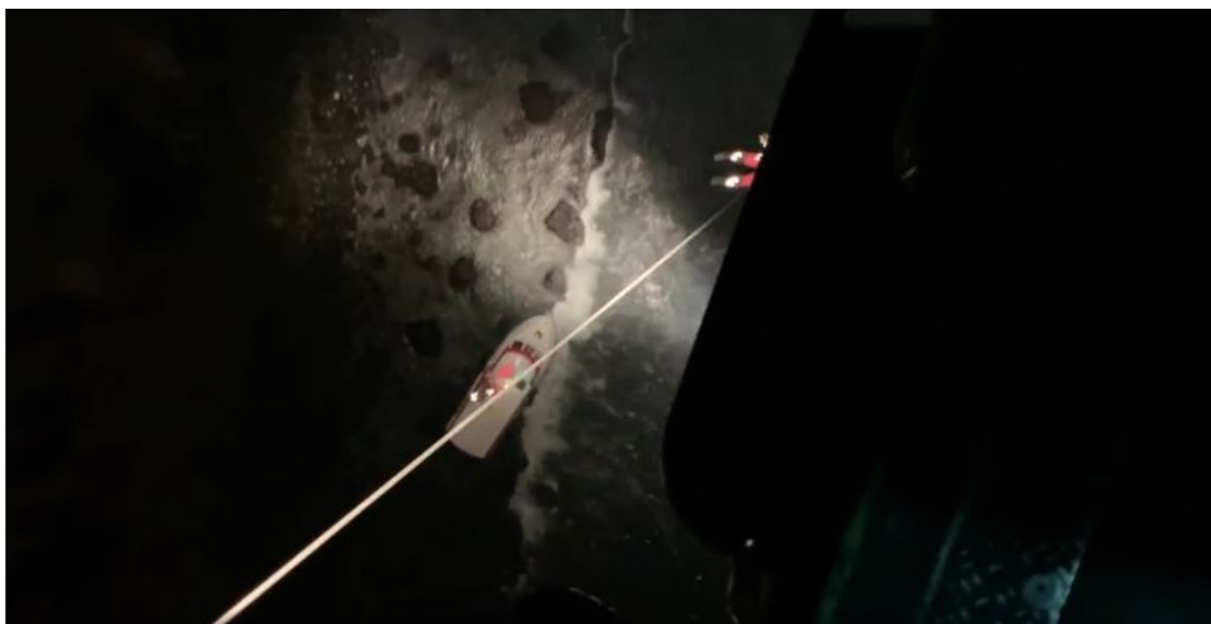
Mynd 4 Skipverjar hífðir um borð í TF-EIR

TF-EIR þyrta LHG var boðuð út kl. 00:10 og fór hún í loftið kl. 00:49. Var þyrta komin á strandstað 02:35 en þar sem Digranes var svo nálægt bjarginu þurfti þyrta að athafna sig í 150-300 feta hæð. Kl. 02:49 voru báðir skipverjarnir komnir um borð í þyrta og var lent með þá á Akureyri kl. 03:55.