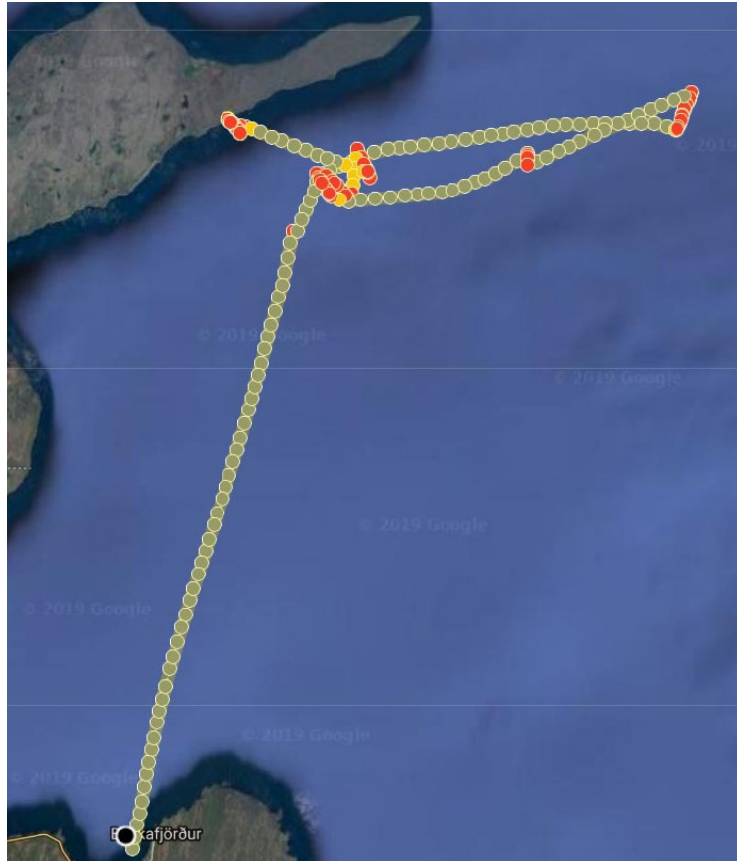
Mynd 2 Ferill Digraness frá því að farið var úr höfn á Bakkafirði

Skipverjarnir vöknudu við að báturinn tók niðri og reyndu að snúa honum frá með hliðarskrúfu og aðalvél en við það tók skrúfan niðri og stöðvaðist. Digranes skorðaðist fast í fjörunni og skipverjar fóru í björgunarbúninga.