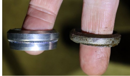
Mynd no 2. Kóninn úr samtenginu hægra megin og nýr kónn vinstra megin til samanburðar