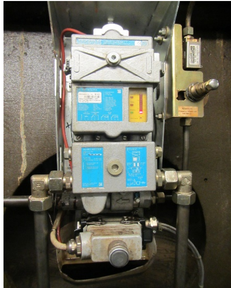
Sveifarhússkynjarinn (Oil Mist Detector)