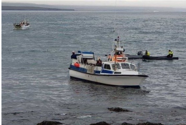
Óskar SK 13 á strandstað