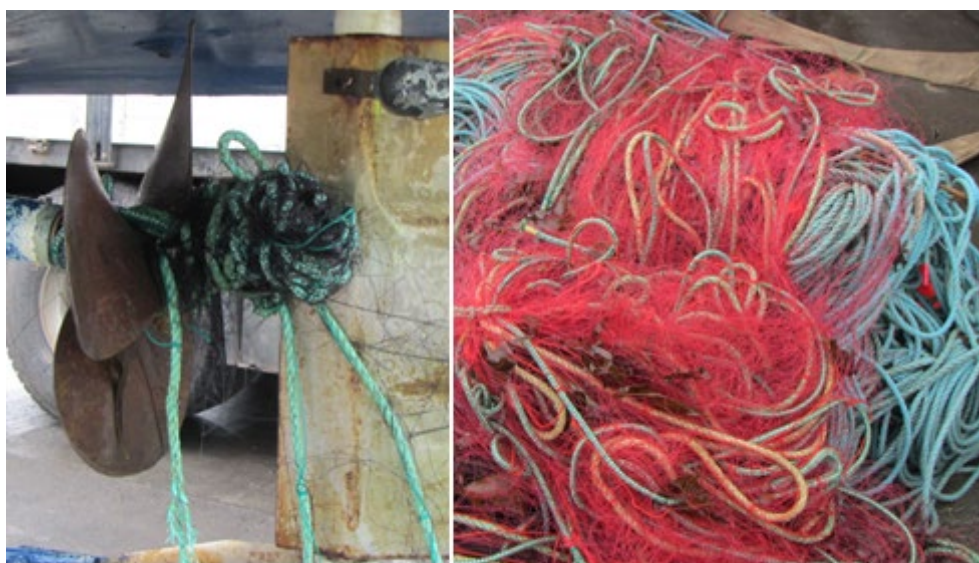
Mynd 5 Veiðarfærin í skrúfunni og þau sem voru um borð