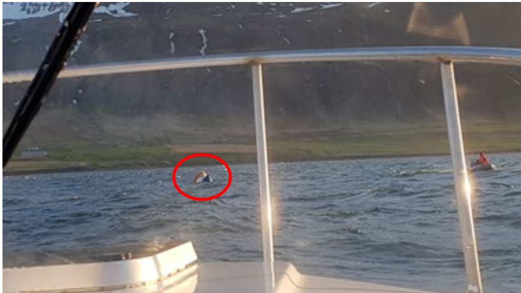
Mynd 2 Stefnið á Sæfara upp úr sjó

Mynd 2 sýnir hvernig stefnið á Sæfara stendur upp úr sjónum eftir björgunaraðgerðir en á myndinni má einnig sjá veður og sjólag á staðnum.