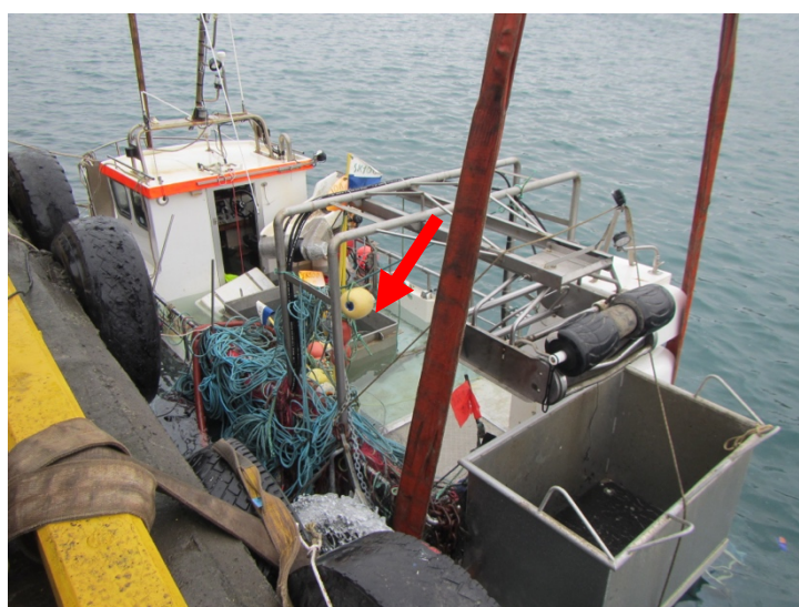
Mynd 4 Þilfarið, kassinn aftur á og lestaropið (rauða örin)