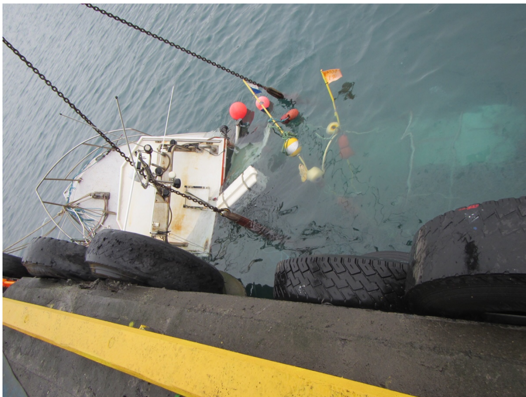
Mynd 3 Sæfari kominn í höfn

Sæfari var dreginn til hafnar á Sauðárkrók og hífður á land þar. Á mynd 3 sést þegar hann var kominn að bryggju og verið að setja á hann stroffur til hífinga til að dæla úr honum.